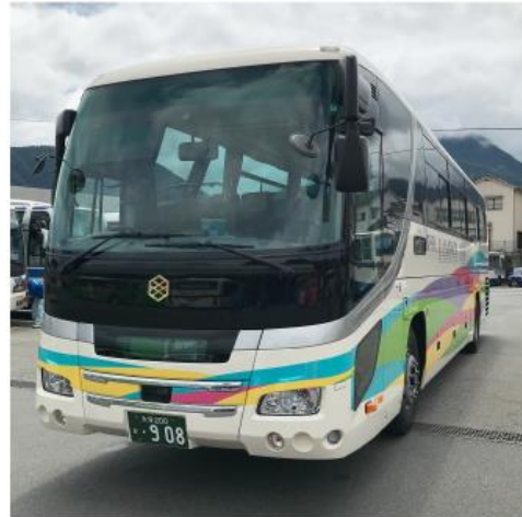
亀の井バス株式会社