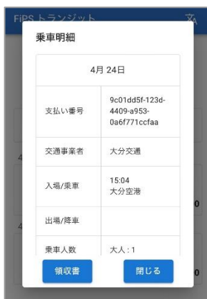
乗車明細・領収書発行画面