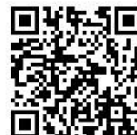
乗降履歴照会サービスは こちらから