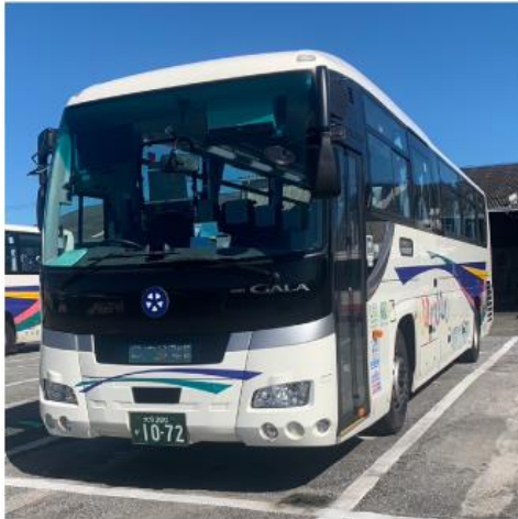
大分交通株式会社

本サービスにおきまして、クレディセゾンはタッチ決済導入の支援を行い、インバウンド観光客を含む国内移動における利便性の向上に努めてまいります。