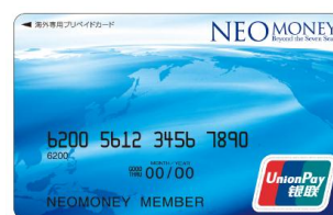
NEO MONEY 銀聯

また、6月1日よりすべての「NEO MONEY」において、ご利用可能額の拡大や海外サービス手数料の低減などサービスの一部を変更し、より便利でお得にご利用いただけるようになります。