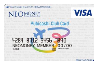
Yubisashi Club Card (NEO MONEY)