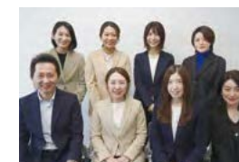
広報室 制作メンバー

5回目の発行となる本誌は、2023年度第2四半期決算説明会資料(2023年11月)にて公表した当社の成長ストーリーに加え、現中期経営計画(2022-2024年度)の最終年度目標である連結事業利益700億円の1年前倒し達成計画、スルガ銀行(株)との資本業務提携など、ビジネスモデル、事業ポートフォリオの変遷を記載し、総合生活サービスグループとして新たな取り組みを進めている当社グループの今後の成長性をわかりやすくまとめました。また、サステナビリティ重要課題(マテリアリティ)と事業戦略を関連付け、各事業がどのような価値提供につながっているかというポイントも意識し表現しています。本誌は、広報室が中心となり、社内の幅広い関係部署と連携し作成していますが、今後もステークホルダーの皆さまとコミュニケーションをさらに深めるために、読者の皆さまからの率直なご意見を頂戴し、適切な情報開示に努め、内容をより一層充実させていくよう取り組んでいきます。