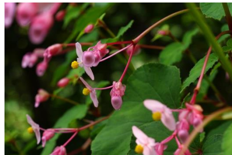
シュウカイドウ(8月下旬～10月上旬)