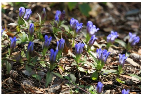
リンドウ(10月上旬～11月中旬)