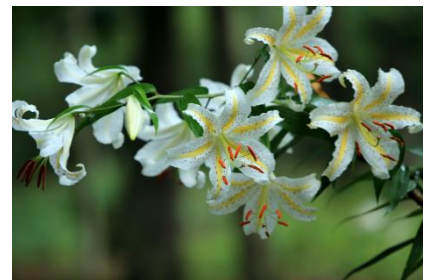
ヤマユリ (7月下旬～8月上旬)