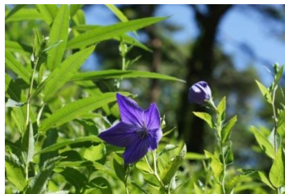
キキョウ (7月中旬から8月下旬)