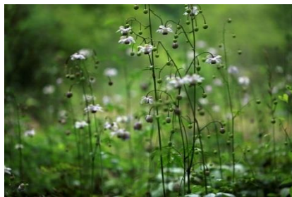
レンゲショウマ (7月下旬～8月下旬)