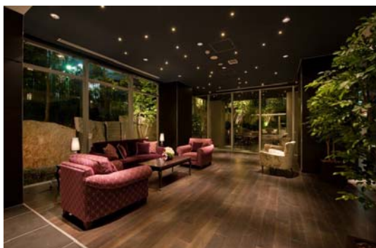
エントランスホール