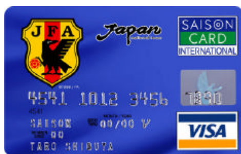
レギュラーカード(VISA/MasterCard/JCB)