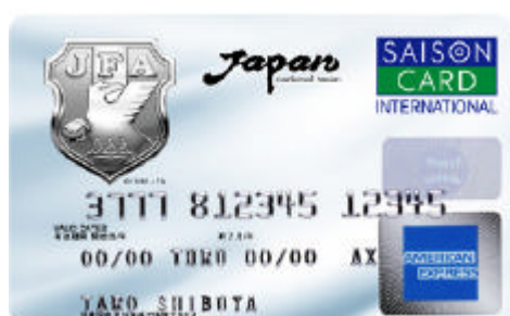
レギュラーカード(アメリカン・エキスプレス・カード)