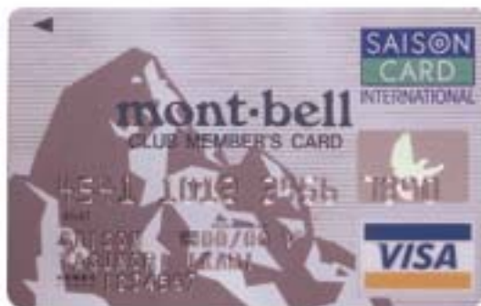
mont-bell CLUB MEMBER'S カード《セゾン》

「mont-bell CLUB MEMBER'S カード《セゾン》」、「mont-bell CLUB MEMBER'S ゴールドカード《セゾン》」は、モンベルクラブ会員に対して発行するメンバーズカードになります。《セゾン》カード機能の他、モンベルが提携する全国のホテル・ペンション・ロッジなどの優待割引やオリジナルカタログ・ステッカーなどがもらえる特典があります。また、カードのご利用によりモンベルポイントがつき、貯まったポイントをモンベル直営店での商品購入やモンベルオリジナルグッズの交換ができます。更に12月末日までにお申込みいただいた方にはカードの発行時にモンベルポイントを500ポイントプレゼント致します。